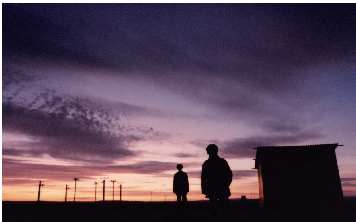
Mit Verlust ist zu rechnen