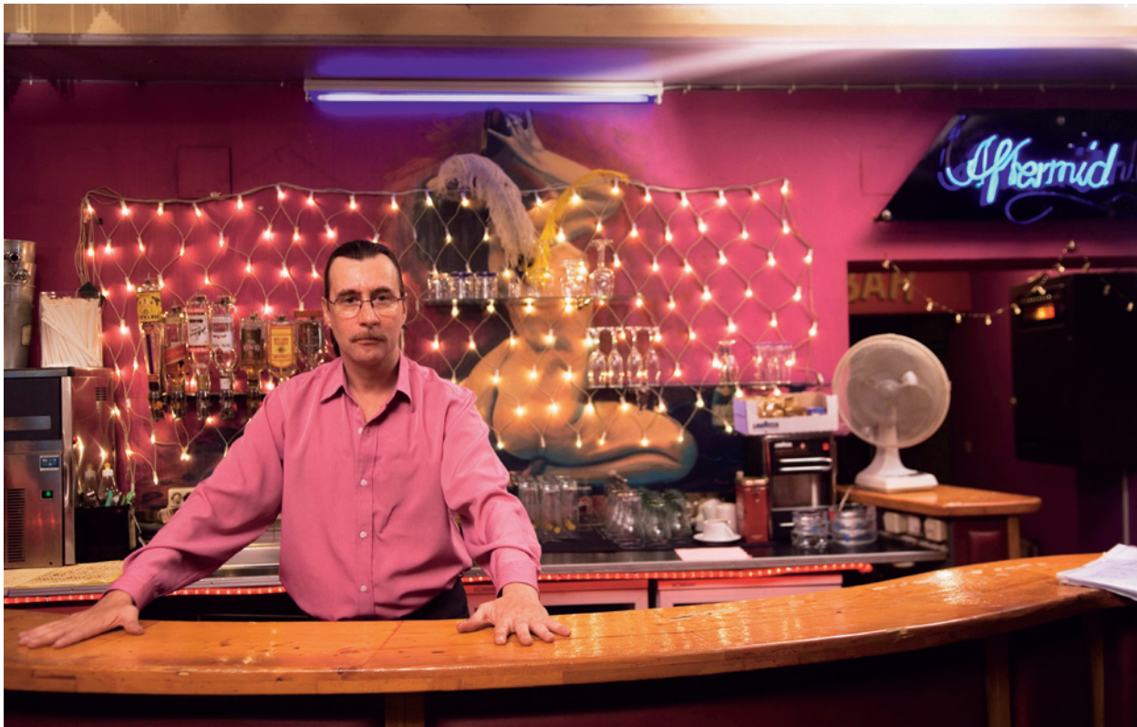
Kurz davor ist es passiert

die sich üblicherweise keine dokumentarische Aufmerksamkeit richten würde. Er hat aber seine eigene Aufmerksamkeit auf sich selbst gerichtet, und ist zu einem Filmemacher der eigenen Existenz geworden – mit dem Erwerb einer Videokamera beginnt eine Art Selbstinventur, deren (jedenfalls in Frimmels Montage) erste Einstellung eine Begehung der eigenen Wohnung ist, die zugleich eine Begehung des eigenen Lebens ist. Das Bett (Sexualität), der Kühlschrank (Ernährung und Gesundheit), der Fernseher (Außenwelt), der Garten (Natur), all das verweist auf Kulturtechniken, die ein vegetatives Leben umgeben. Haindl macht sich selbst zum Gegenstand der Erzählung (Narrativierung), er spricht unbefangen in der ersten Person von sich (Subjektivierung) und adressiert sich selbst als solche, und er ist sich der Rückkopplungen seiner privaten Medientechnik bewusst (Reflexivierung) – die drei Strategien treten hier in den Dienst einer audiovisuellen Selbsterhaltung, eines medialen Überlebenstrainings, die erst durch die Herausgeberschaft von Rainer Frimmel auf die andere Seite wechseln und zu einem dokumentarischen Film in der Subjekt-Objekt-Relation werden.