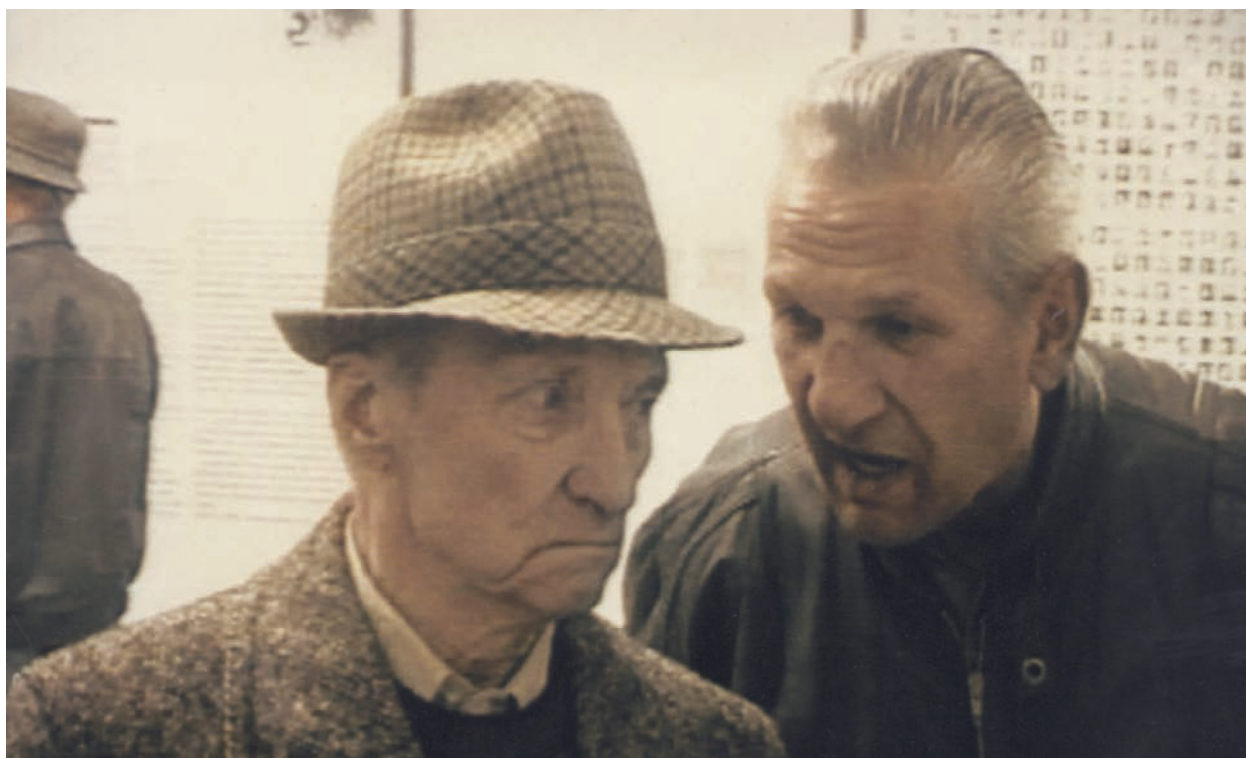
Jenseits des Krieges